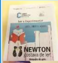
Na biblioteca a história transforma-se numa atividade experimental "Newton gostava de ler- lâmpada de gelo"