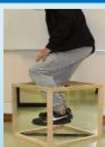
Laboratório de Física