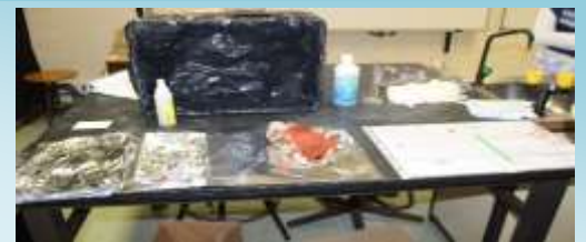
A escola transformou-se na cena de um crime e os alunos do 9º ano formaram a equipa CSI "Laboratório de Ciência Forense"