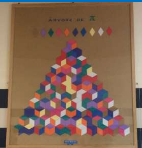
Inauguração da Árvore de Pi Um trabalho de alunos do Clube da Matemática